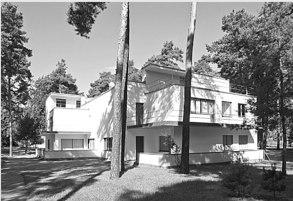
Abb. 1: Das Meisterhaus von Walter Gropius (1925/1926)